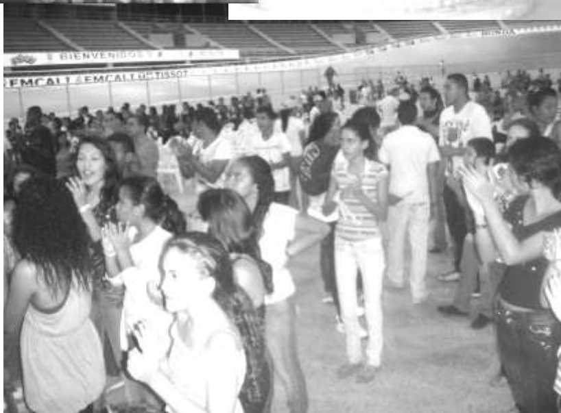
Ungdomsmöte i en cykelvelodrom i Cali.