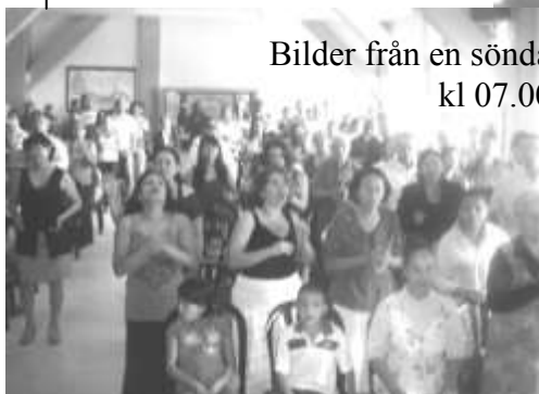
Bilder från en söndagsgudstjänst, kl 07.00!