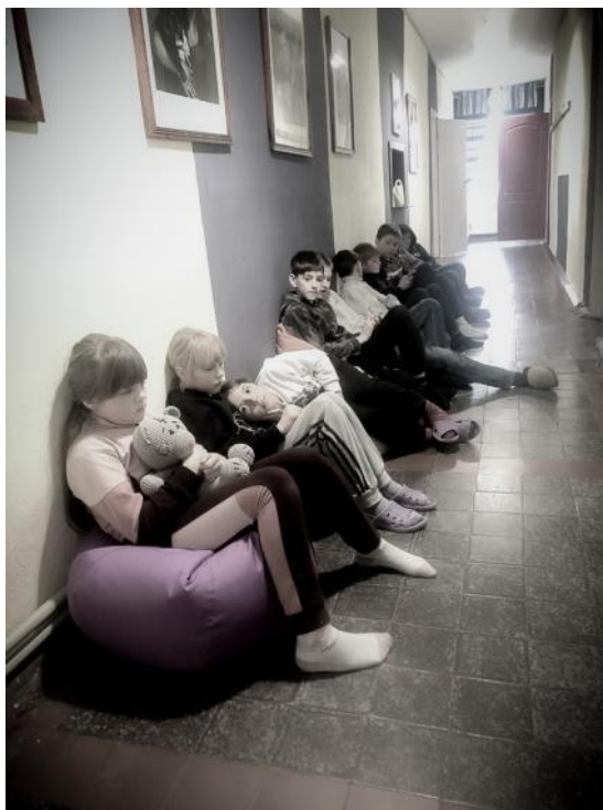
Barn i skolans korridor. Väntan,,,,,,,,,