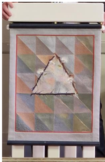
Suzan Östman Bäckman

Vi kan verkligen vara både stolta och nöjda med att antependiet är åter på plats längst fram i gudstjänstsalen. Under många år fanns antependiet i bönerummet på den gamla talarstolen efter att vi ville ha mer plats för rörlighet vid altaret. Omväxling förnöjer tänker jag.